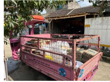
Gambar 4. Pengangkutan sampah

Sisa sampah rumah tangga yang tidak disetorkan ke bank sampah seperti sampah organik, dikelola oleh perempuan untuk dibuat kompos, sedangkan sampah residu berupa kemasan multilayer seperti kemasan kopi dan mie instan dimanfaatkan untuk membuat berbagai kerajinan dan ecobrick . Saat ini, jumlah sampah yang tidak dikelola sudah berkurang, karena sampah anorganik telah disetorkan ke bank sampah. Adanya Bank Sampah Bersinar telah menjadikan rumah tangga mengelola sampahnya. Pengelolaan sampah melalui bank sampah dipandang menguntungkan, karena dapat mengelola sampah dengan bijak dan bernilai ekonomis.