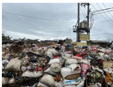
Gambar 1. Kondisi TPS

Kabupaten Bandung merupakan daerah rawan banjir karena berlokasi di selatan cekungan Bandung dan termasuk wilayah aliran Sungai Citarum, sehingga memiliki risiko terkena banjir setiap tahunnya. Risiko tersebut akan sering terjadi apabila sampah dibuang ke sungai dan menyumbat atau menjadikan pendangkalan di sungai. Sampah di wilayah ini belum terkelola dengan baik, sehingga terjadi penumpukan sampah di Tempat Penampungan Sementara (TPS). Kondisi ini terjadi karena produksi sampah tidak sebanding dengan kemampuan dalam pengelolaannya, sehingga menjadi masalah yang semakin serius.