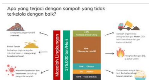
Gambar 5. Materi Sosialisasi

Tahap peningkatan kesadaran perempuan tentang masalah sampah, lingkungan, pengelolaan sampah, perilaku bersih sehat, hingga pengenalan tentang bank sampah dilaksanakan melalui kegiatan sosialisasi (gambar 5). Materi tersebut dijelaskan kepada target sasaran tentang kondisi dan masalahnya serta diberikan penyadaran bahwa kondisi tersebut sudah darurat, sehingga dibutuhkan adanya perubahan perilaku dalam pengelolaan sampah. Selain itu, diberi penjelasan tentang bank sampah dan berbagai keuntungan melakukan pengelolaan sampah melalui bank sampah. Sosialisasi dilakukan untuk meningkatkan kesadaran perempuan dan membuka pikirannya tentang permasalahan sampah. Kegiatan ini dilakukan oleh tim Community Development Bank Sampah Bersinar (gambar 6).