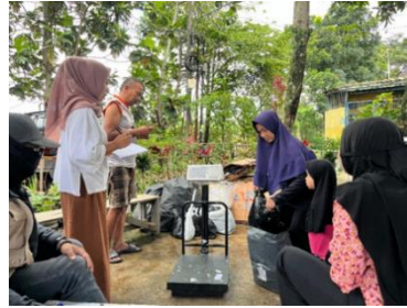
Gambar 3. Penimbangan dan Pencatatan Sampah