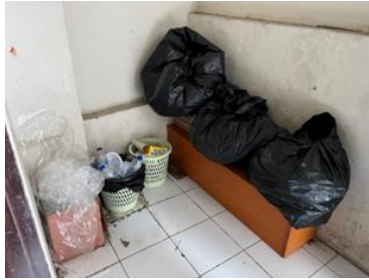
Gambar 2. Pemilahan Sampah Rumah Tangga

sampah dipilah dahulu dan dikumpulkan setiap jenis sampahnya untuk disetorkan, sehingga sampah bisa dimanfaatkan untuk ditabung ke bank sampah. Sisa sampah lainnya dikumpulkan kemudian diangkut oleh truk sampah.” (Informan IR, 12 Maret 2024).