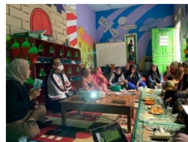
Gambar 6. Kegiatan Sosialisasi dan Edukasi